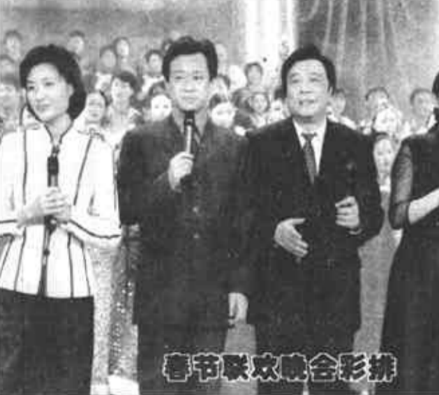
2月8日晚,中央电视台在1号演播大厅进行了1999年春节联欢晚会彩排。此次晚会以“欢声笑语张灯结彩春节大团圆,载歌载舞万众欢腾迈向新世纪”为主题,突出了“乐”、“美”、“情”、“奋”。这是这台晚会的主持人赵忠祥(左三)、倪萍(左四)、周涛(左一)和朱军(左二)