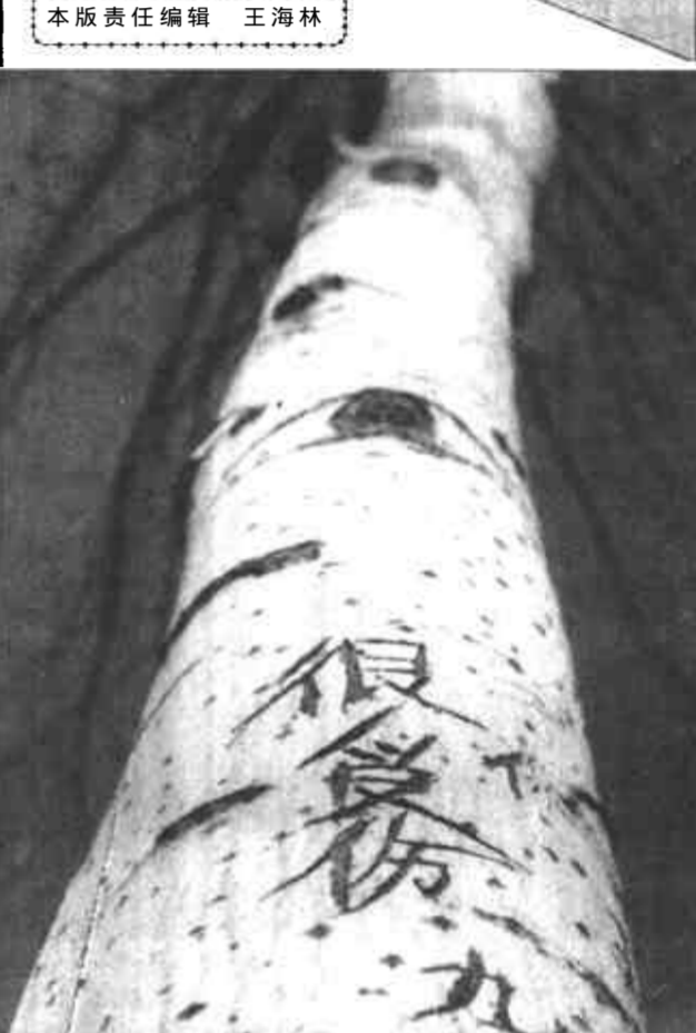
树木也需要关心和爱护

时下，一年一度的新春佳节即将来临，许多在外地做工的打工者返乡时，由于旅途疲劳，难免会有一时的疏忽，携带的钱物就有可能发生被盗、遗失或损坏等意外情况。在此，笔者提醒广大返乡过年的打工者，不要随身携带钱物，最好在本地通过邮局汇寄回家，自己空手上路既轻松省事又安全。 (读者 杨红)